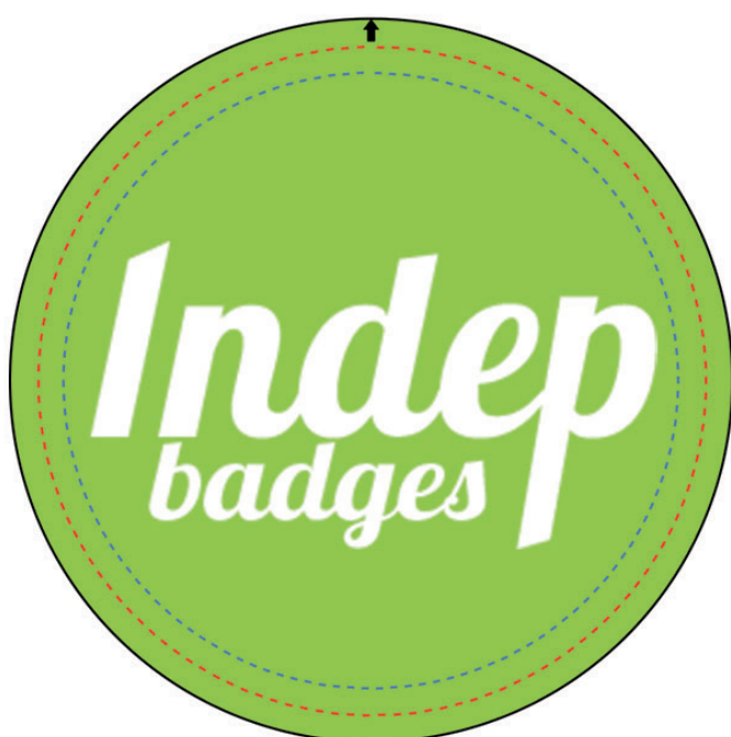
Exemple de mise en page

Le fond perdu : c'est la marge du badge, l'endroit jusqu'au où vous devez mettre le fond de votre visuel (bloc de couleur, photo ou autre) ainsi, les couleurs du visuel débordent sur le papier d'impression et, il n'y a pas de souci à la découpe.