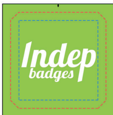
Exemple de mise en page

Le fond perdu : c'est la marge du badge, l'endroit jusqu'au où vous devez mettre le fond de votre visuel (bloc de couleur, photo ou autre) ainsi, les couleurs du visuel débordent sur le papier d'impression et, il n'y a pas de souci à la découpe.