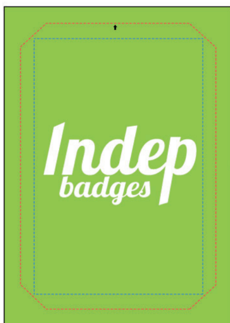
Exemple de mise en page

Le fond perdu : c'est la marge du badge, l'endroit jusqu'au où vous devez mettre le fond de votre visuel (bloc de couleur, photo ou autre) ainsi, les couleurs du visuel débordent sur le papier d'impression et, il n'y a pas de souci à la découpe.