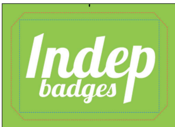
Exemple de mise en page

Le fond perdu : c'est la marge du badge, l'endroit jusqu'au où vous devez mettre le fond de votre visuel (bloc de couleur, photo ou autre) ainsi, les couleurs du visuel débordent sur le papier d'impression et, il n'y a pas de souci à la découpe.