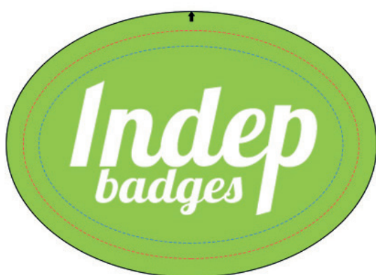
Exemple de mise en page

Le fond perdu : c'est la marge du badge, l'endroit jusqu'au où vous devez mettre le fond de votre visuel (bloc de couleur, photo ou autre) ainsi, les couleurs du visuel débordent sur le papier d'impression et, il n'y a pas de souci à la découpe.