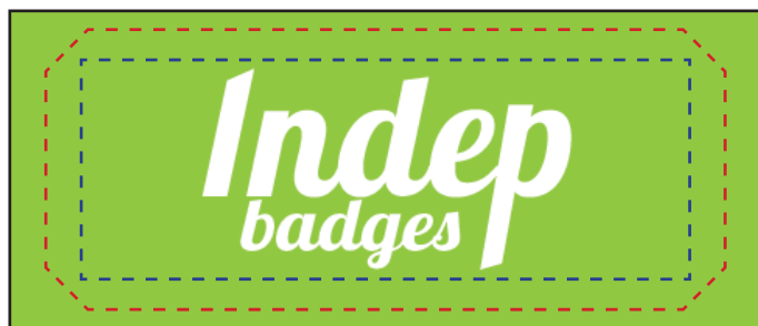
Exemple de mise en page

Le fond perdu : c'est la marge du badge, l'endroit jusqu'au où vous devez mettre le fond de votre visuel (bloc de couleur, photo ou autre) ainsi, les couleurs du visuel débordent sur le papier d'impression et, il n'y a pas de souci à la découpe.