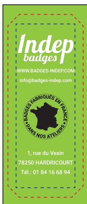
Exemple de mise en page

Le fond perdu : c'est la marge du badge, l'endroit jusqu'au où vous devez mettre le fond de votre visuel (bloc de couleur, photo ou autre) ainsi, les couleurs du visuel débordent sur le papier d'impression et, il n'y a pas de souci à la découpe.