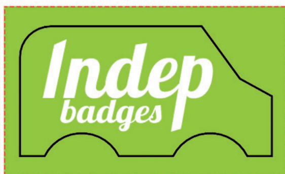
Exemple de mise en page

Zone A Fond perdu : c'est la marge du porte clé, l'endroit jusqu'au où vous devez mettre le fond de votre visuel (bloc de couleur, photo ou autre) ainsi, les couleurs du visuel débordent sur le papier d'impression et, il n'y a pas de souci à la découpe.