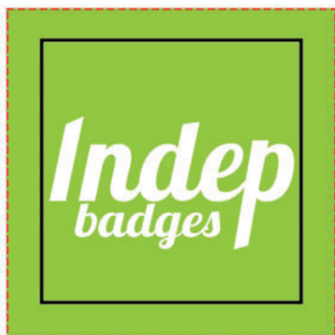
Exemple de mise en page

Zone A Fond perdu : c'est la marge du porte clé, l'endroit jusqu'au où vous devez mettre le fond de votre visuel (bloc de couleur, photo ou autre) ainsi, les couleurs du visuel débordent sur le papier d'impression et, il n'y a pas de souci à la découpe.