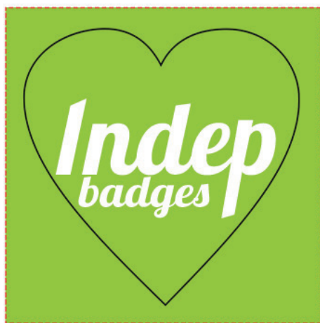
Exemple de mise en page

Zone A Fond perdu : c'est la marge du porte clé, l'endroit jusqu'au où vous devez mettre le fond de votre visuel (bloc de couleur, photo ou autre) ainsi, les couleurs du visuel débordent sur le papier d'impression et, il n'y a pas de souci à la découpe.