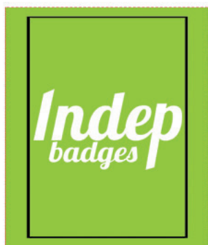
Exemple de mise en page

Zone A Fond perdu : c'est la marge du porte clé, l'endroit jusqu'au où vous devez mettre le fond de votre visuel (bloc de couleur, photo ou autre) ainsi, les couleurs du visuel débordent sur le papier d'impression et, il n'y a pas de souci à la découpe.