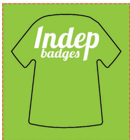
Exemple de mise en page

Zone A Fond perdu : c'est la marge du porte clé, l'endroit jusqu'au où vous devez mettre le fond de votre visuel (bloc de couleur, photo ou autre) ainsi, les couleurs du visuel débordent sur le papier d'impression et, il n'y a pas de souci à la découpe.