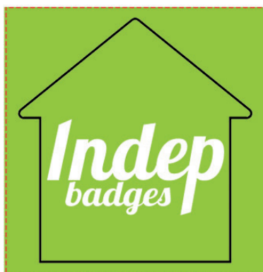
Exemple de mise en page

Zone A Fond perdu : c'est la marge du porte clé, l'endroit jusqu'au où vous devez mettre le fond de votre visuel (bloc de couleur, photo ou autre) ainsi, les couleurs du visuel débordent sur le papier d'impression et, il n'y a pas de souci à la découpe.