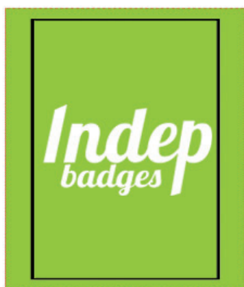
Exemple de mise en page

Zone A Fond perdu : c'est la marge du porte clé, l'endroit jusqu'au où vous devez mettre le fond de votre visuel (bloc de couleur, photo ou autre) ainsi, les couleurs du visuel débordent sur le papier d'impression et, il n'y a pas de souci à la découpe.