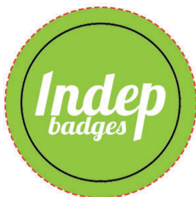
Exemple de mise en page

Zone A Fond perdu : c'est la marge du porte clé, l'endroit jusqu'au où vous devez mettre le fond de votre visuel (bloc de couleur, photo ou autre) ainsi, les couleurs du visuel débordent sur le papier d'impression et, il n'y a pas de souci à la découpe.