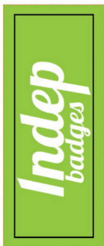
Exemple de mise en page

Zone A Fond perdu : c'est la marge du porte clé, l'endroit jusqu'au où vous devez mettre le fond de votre visuel (bloc de couleur, photo ou autre) ainsi, les couleurs du visuel débordent sur le papier d'impression et, il n'y a pas de souci à la découpe.